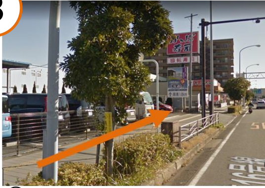
⑧ 横須賀青果市場を左手に見ながら直進 (かっぱ寿司等あります)